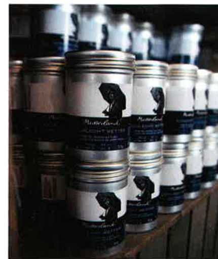
Exklusiv gemischt: Tee von Mutterland